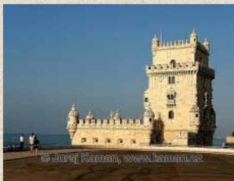
Betlémska věž v Lisabonu